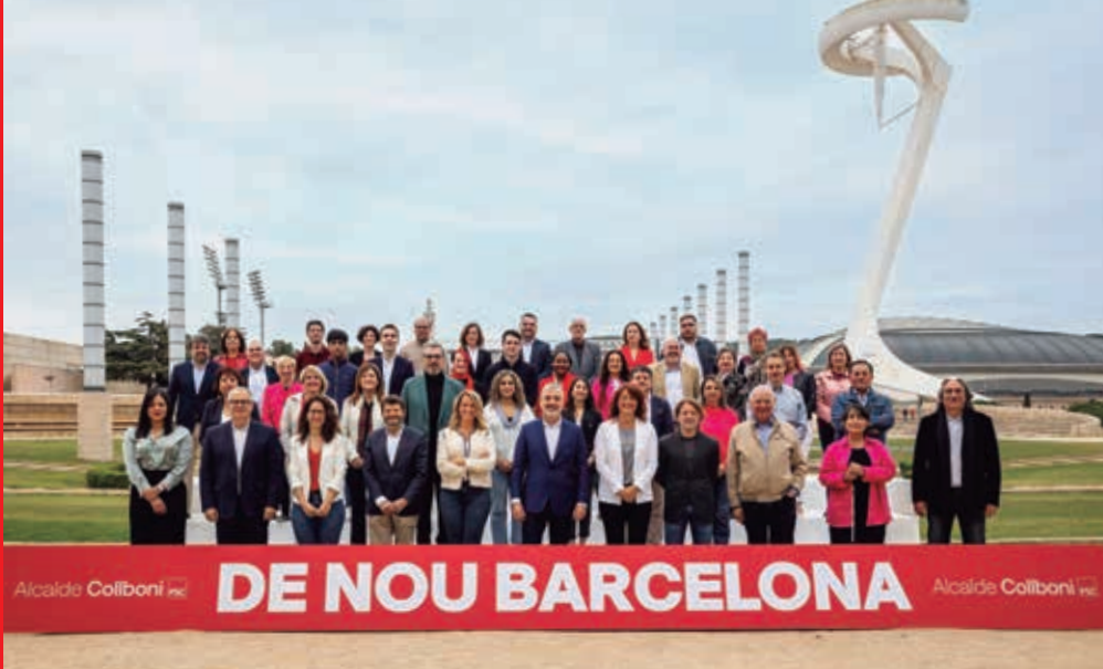
L'equip del PSC, preparat per governar.